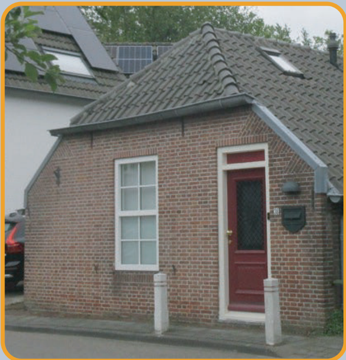
Vereniging Oud Ede

Dit onbewoonbaar verklaarde arbeiderswoning is van 1962 tot 1973 gebruikt door de Vereniging Oud Ede als hulpgebouwtje. In dit arbeiderswoning – dat ook 't Driehoekje werd genoemd – werden dingen opgeslagen en activiteiten georganiseerd. Hierin kon je bijvoorbeeld op een avond naar een verzameling oude foto's kijken. In 1972 werd het gebouw steeds slechter, waardoor de opgeslagen spullen verplaatst moesten worden. In 1974 kwam er een pottenbakker in het boerderijtje wonen. Ook nu wordt het weer gebruikt als woonhuis.