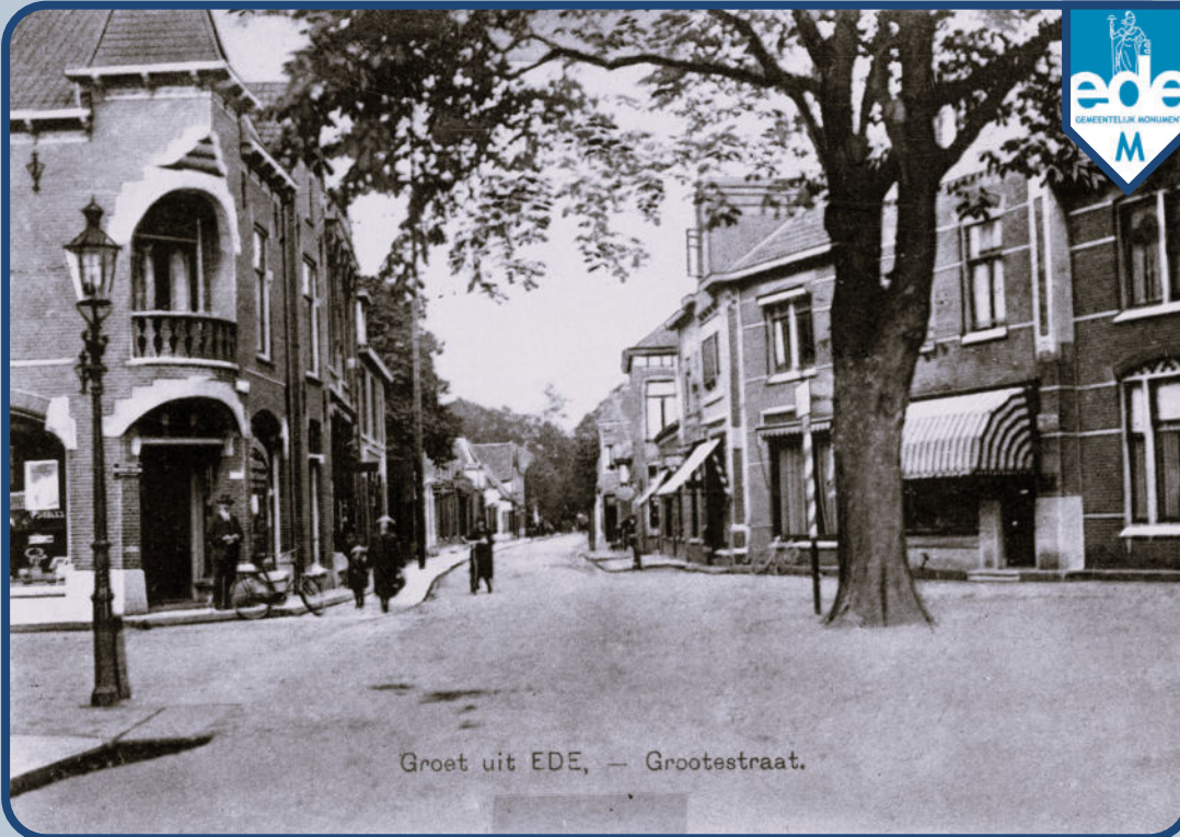
Groet uit EDE, — Grootestraat.