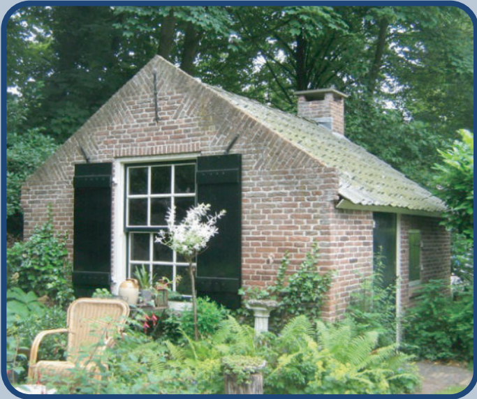
Vereniging Oud Ede

In 1942, tijdens de Tweede Wereldoorlog, kreeg de Vereniging Oud Ede dit bakhuis van meneer Jochemsen. Hij [Jochemsen] stond op het punt zijn boerderij en het bakhuis af te breken. Een bakhuis hoorde vroeger bij een boerderij. In het bakhuis zat een bakoven waarin brood en koek werden gebakken. Het bakhuis werd afgebroken en bij het boerderijtje van de vereniging opnieuw opgebouwd. In het gebouwtje werden oude voorwerpen bewaard.