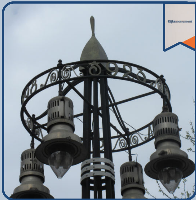
Vereniging Oud Ede

Deze Wilhelmina lantaarn kreeg Ede vorig jaar [1923] van de Edese burgerij, omdat koningin Wilhelmina toen 25 jaar koningin van Nederland was. De gaslantaarn is gemaakt door de Edese Machinefabriek en IJzergieterij Henneman. Aan de spits (bovenin) hangt een dubbele ring met daarin de tekst 'WILHELMINA 9 SEPT. 1898 - 1923'. Aan deze ring hangen vier gasarmaturen. De gaslantaarn is ontworpen in de stijl van de Amsterdamse School.